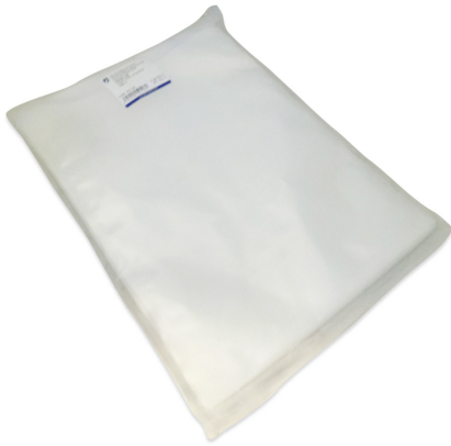
Image du paquet

Règlement (CE) n° 2023/2006 de la Commission du 22 décembre 2006 relatif aux bonnes pratiques de fabrication des matériaux et objets destinés à entrer en contact avec des denrées alimentaires.