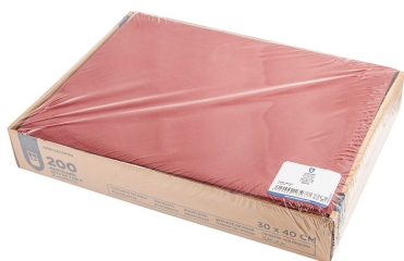
Image du paquet