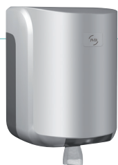
REF 8 99 736 Cleanline Dévidoir maxi capot gris métal UL 1 : 6