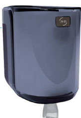
REF 8 99 737 Cleanline Dévidoir maxi capot transparent fumé UL 1 : 6