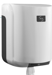
REF 8 99 605 Cleanline Dévidoir maxi capot blanc UL 1 : 6